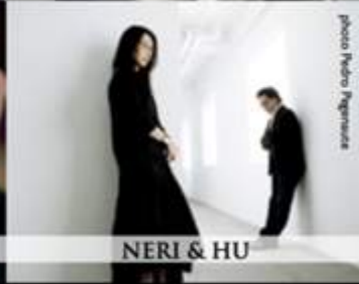
NERI & HU